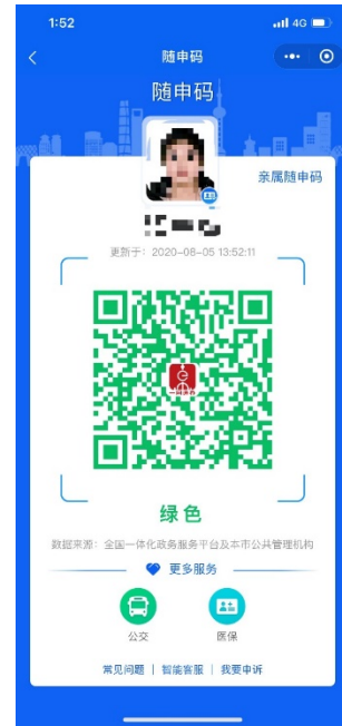
绿色随申码示意图